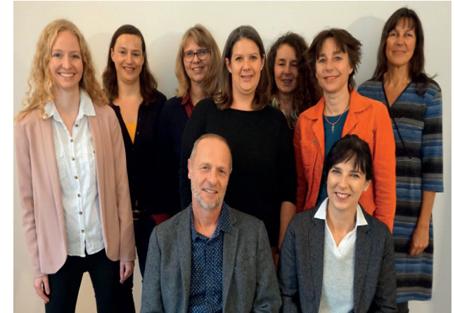
Mitarbeitende des sozialpsychiatrischen Dienstes